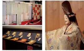
能楽博物館(入館料500円) 「能を知る会 ® 」(本ノブレット記載公演)