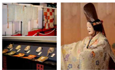
能楽博物館(入館料500円) 「能を知る会 ® 」(本パンフレット記載公演)