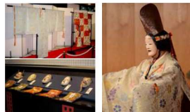
能楽博物館(入館料500円) 「能を知る会」(本パンフレット記載公演)