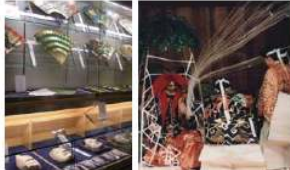
能楽博物館(入館料500円) 「能を知る会」(本パンフレット記載公演)